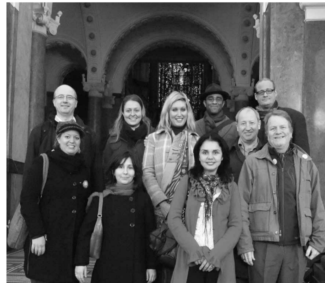
Udeleženci na drugem projektne sestanku marca 2011 na Univerzi v Sofiji (Bolgarija).