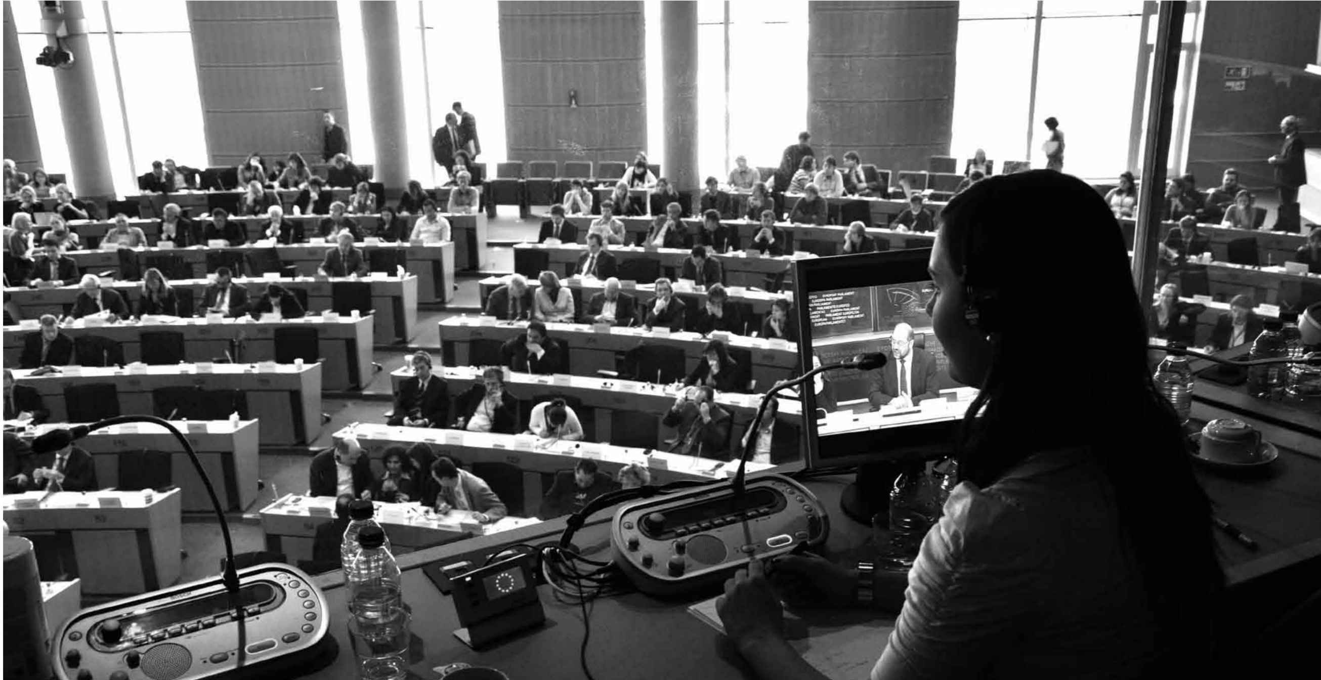
Obisk institucij EU kot sestavni del študijskega programa Tolmačenje, fotografija: Matevž Pajek.

- usposobljenost za vodenje ustanov ali njihovih delov, ki se ukvarjajo z zbiranjem, shranjevanjem in posredovanjem informacij (npr. informacijski centri, oddelki za dokumentacijo), - usposobljenost za promoviranje in razširjanje vpliva ustanov, ki se ukvarjajo z zbiranjem, shranjevanjem in posredovanjem informacij, - usposobljenost za kritično uporabo novosti v teoriji in praksi svojega strokovnega in delovnega področja, - usposobljenost za samostojno raziskovanje in objavlanje raziskovalnih rezultatov ter usposobljenost za skupinsko raziskovalno in razvojno delo, - ustvarjalnost in izvirnost pri rutinskem in razvojnem delu ter raziskovanju na svojem področju zavedanje pomena in vloge informacij v konkretni ustanovi in sodobni družbi nasploh.