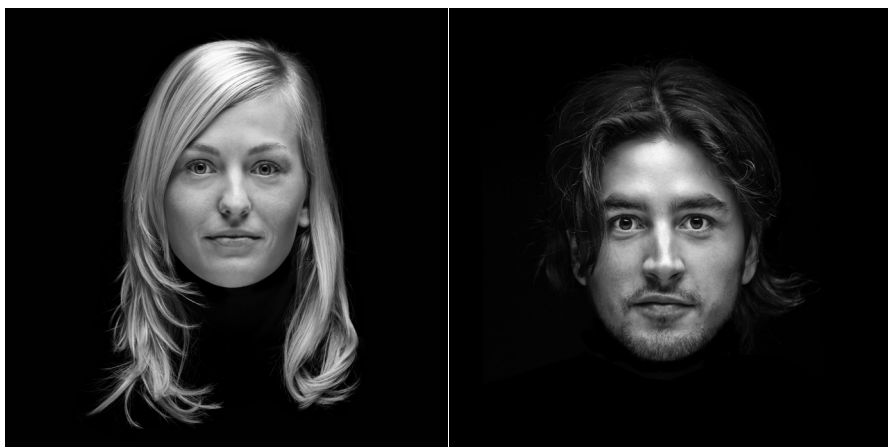
uporaba črno-belih portrezov študentov